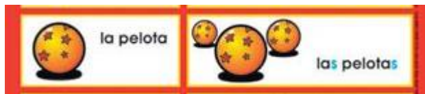
(Singular) (Plural) Género: femenino