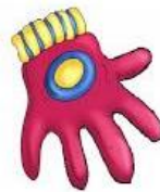
El guante (Singular)