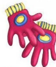
Los guantes ... (Plural)